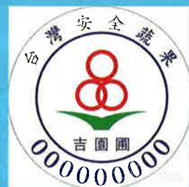
吉園圃 安全蔬果標章2.0