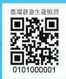
QR Code 生產追溯